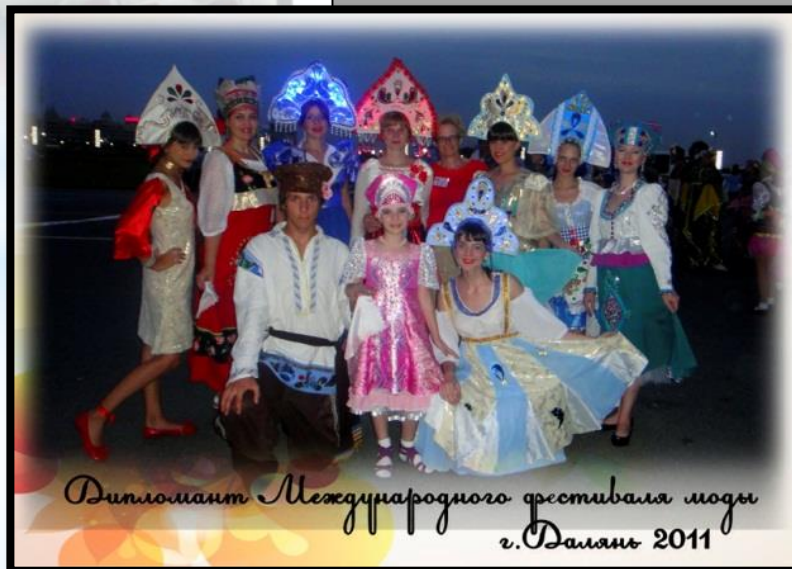
Дипломант Международного фестиваля моды г. Даламь 2011

Партнеры: студенты КГАОУ СПО «Хабаровский технологический колледж».